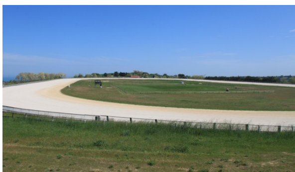
Dall'alto in senso orario: Montecosaro, Civitanova Alta, panorami dall'Ippodromo Mori

Per ulteriori informazioni e per effettuare prenotazioni potete rivolgervi alla sede CAI ogni mercoledì e venerdì dalle ore 19 alle 20, telefonare allo stesso orario allo 0736 45158 oppure consultare il ns. sito www.slowbikeap.it